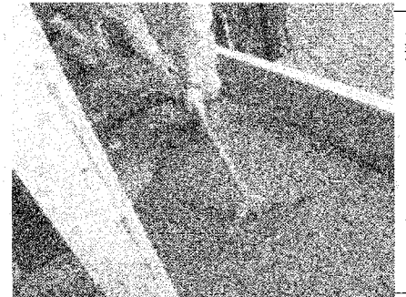
◀木造にコンクリートを組み合わせた独自工法

を高め、入居者が快適に 過ごせるように工夫して います」 また、投資商品として さらに魅力を高めた 「木造4F耐火仕様」 のアパート開発にも注 力。RCや鉄骨に比べ建 築費を抑えつつ、戸数が 増えることで収益性が高 まるため、投資家からの 人気も高い。